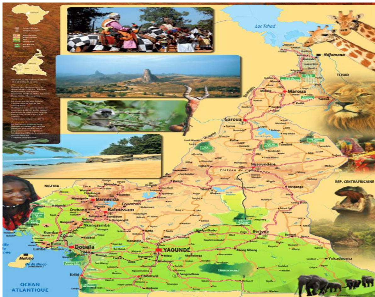
Le Cameroun c'est l'Afrique en miniature

Tourisme balnéaire, tourisme de montagne, tourisme de congrès et d'affaires, tourisme de safari et de chasse, écotourisme et tourisme culturel.